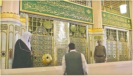
হজরত মুহাম্মদ (সা.)-এর রওজা মোবারক