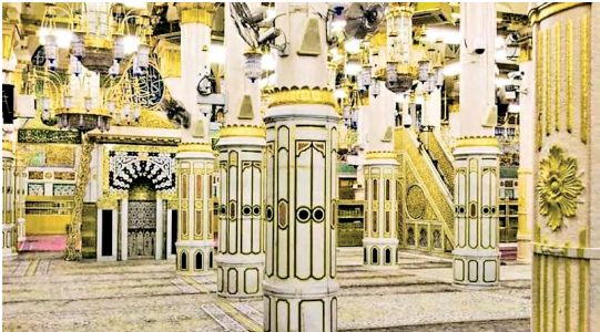
এই অংশটুকু রিয়াজুল জান্নাহ্ (বেহেশতের বাগান) নামে পরিচিত

উম্মুল মুমিনিন আয়েশা (রা.)-এর কক্ষই রাসুল (সা.)-এর ওফাত হয় এবং সেখানেই তাঁকে দাফন করা হয়। মসজিদ সম্প্রসারণ করার পর বর্তমানে তাঁর কবর মোবারক মসজিদে নববির অন্তর্ভুক্ত হয়ে গেছে। রাসুলে করিম (সা.)-এর রওজা মোবারকের পাশে ইসলামের প্রথম খলিফা আবু বকর সিদ্দিক (রা.) ও দ্বিতীয় খলিফা ওমর ফারুক (রা.)-এর কবর রয়েছে। আবু বকর (রা.)-এর রওজার কাছে দাঁড়িয়ে পাঠ করুন : আসসালামু আলাইকা ইয়া খলিফাতা রাসুলিল্লাহি আবু বকর (রা.)। এবার ডান দিকে সরে গিয়ে ওমর (রা.)-এর রওজা মোবারক বরাবর দাঁড়িয়ে পাঠ করুন : আসসালামু আলাইকা ইয়া আমিরাল মুমিনিন ওমর ফারুক (রা.)।